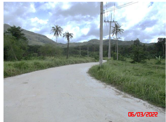
บริเวณในพื้นที่โครงการ