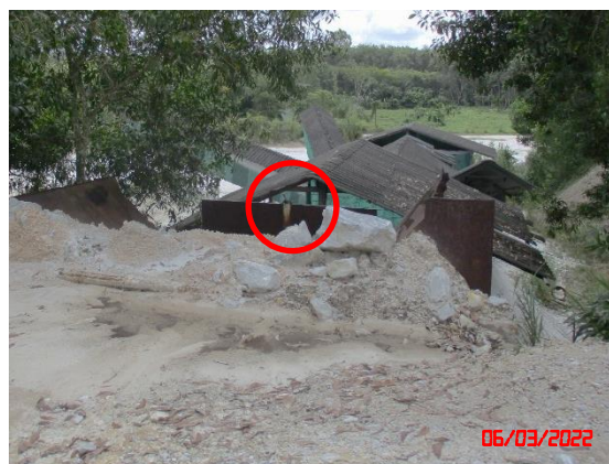
ระบบสเปรย์น้ำ