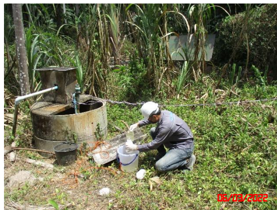
บ่อน้ำต้นไถ่พื้นที่โครงการ