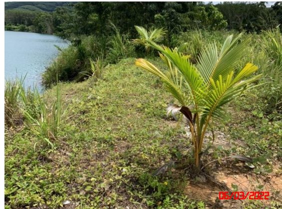
รูปที่ 2-2 พื้นที่เก็บกองเปลือกดิน/เศษหิน