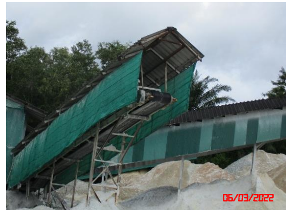
หลังคาปิดคลุมสายพานลำเลียง