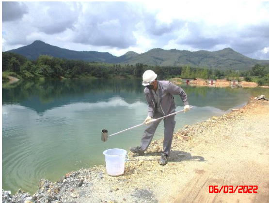
ชุมเหือง