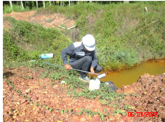
บ่อตักตะกอน