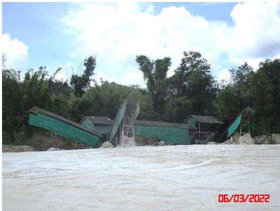
อาคารปิดคลุมโรงโม่หิน