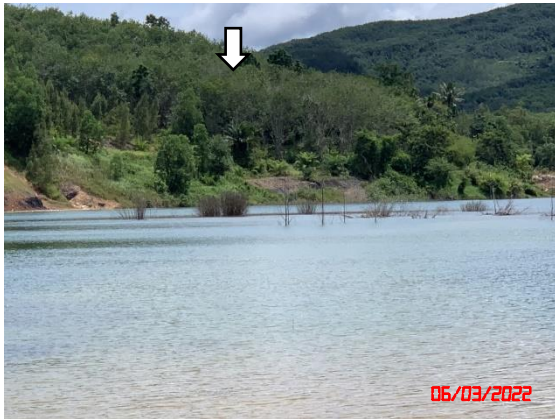
รูปที่ 2-1 แนวเขตพื้นที่เว้นการทำเหมือง