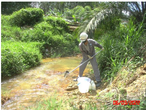
คลองหิราด